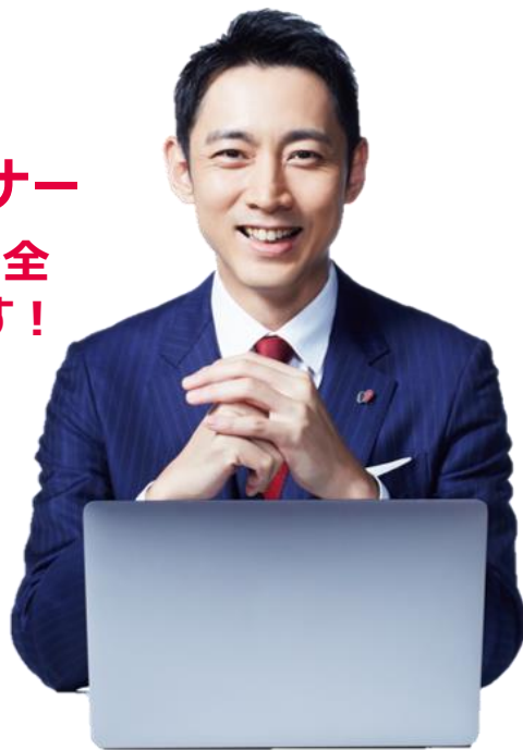
あしたのチームアンバサダー 小泉 孝太郎さん